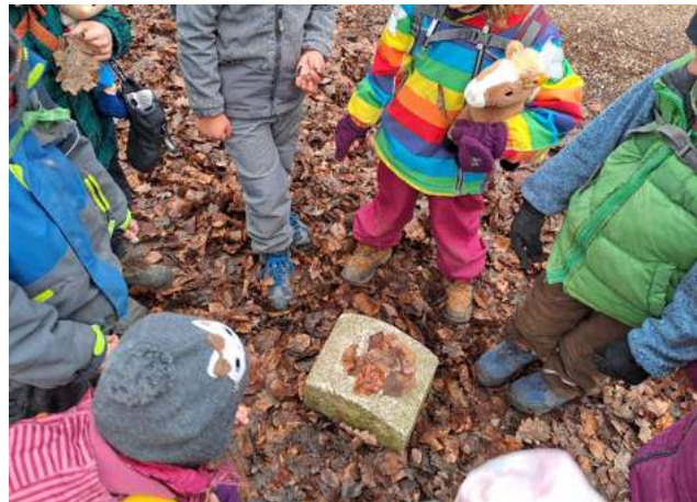
Abstimmung mit verschiedenen Laubblättern