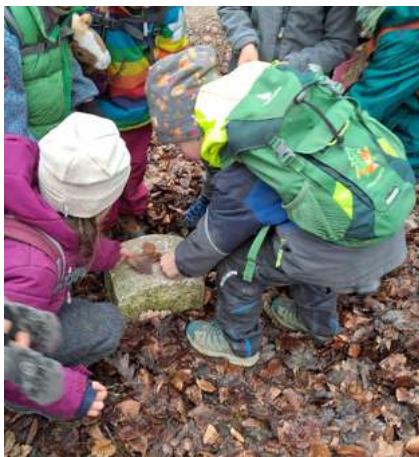
Abstimmung mit verschiedenen Laubblättern